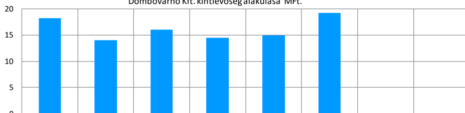
Dombóvárhó Kft. kintlévőség alakulása Mft.