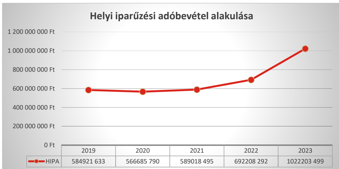
1. ábra Helyi iparűzési adóbevétel alakulása

A helyi adókról szóló törvény alapján az iparűzési adóbevétel különösen a közösségi közlekedésre és a szociális ellátások finanszírozására használható fel.