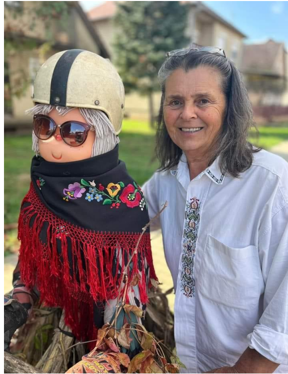
A szerző: Kapinya Mária